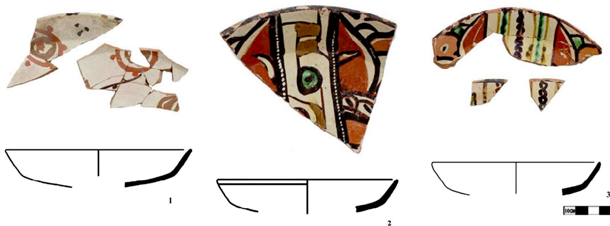
Расм 1. Навбоғтепадан топилган сирланган товоқлар.

Товоқларнинг тавсифи. Товоқлар Маҳмуд Қошғарийнинг “Девони луғоти турк” асарида biqach , деб номланиб (Маҳмуд Қошғарий, 1960. Б. 389), уларнинг юзи ёйикрок, бир оз кенг (ялпок) коса шаклидаги чуқурроқ бўлган идишлардир. Товоқлар турли катта кичик шаклларда сопол, чинни, мис, баъзан мрамардан ҳам тайёрланади. Бундай турдаги идишлар