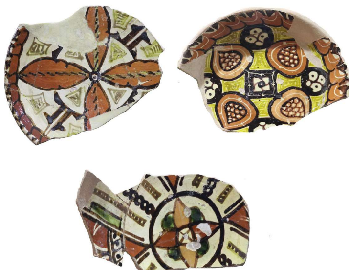
Расм 2. Афросиёбнинг сирланган товоқлари. XI–XIII асрлар.

Нафақат, Самарқандда балки, бутун Ўрта Осиёнинг кулоллик марказларида VIII асрнинг охирдан бошлаб сирланган кулоллик идишлари ишлаб чиқариш бошланди. Дастлабки, сирланган сополларнинг сифат даражаси бир мунча паст бўлиб, идиш сиртига рангсиз-қорамтир сир ва кўкимтир-яшил нақшлар берилган. Кейинчалик, жигарранг бўёқ билан нақш бериш пайдо бўлди. Самарқандлик кулолларнинг дастлабки сирланган идишлари коса, пиёла ва лаганлардан иборат бўлган. Шунингдек, уларнинг нақш мотивлари анча содда эди. Самарқанднинг IX–X аср бошларидаги сирланган идишлари янги сифат босқичига кўтарилган ва айнан шу даврда Афросиёб сирланган сополлари деб номланувчи алоҳида йўналиш пайдо бўлади (Ташходжаев, 1967. С. 9–10). Афросиёб сирланган сополлари ўзининг сир бериш технологияси ва нақш бериш услубига кўра атрофдаги бошқа кулоллик марказларига таъсир кўрсатган. Самарқанда сирланган кулоллик буюмлари ишлаб чиқаришда IX–X асрларда кўплаб нақш беришлар мотивлари маълум бир андозага солинди. Афросиёбда сирланган сопол ишлаб чиқаришнинг дастлабки босқичларида яъни, XI асрнинг I ярмида уста-кулоллар асосан тўқ-кўк, ярим шаффоф яшил-кўкимтир (бирюза) сирлардан фойдаланишган. Кейинроқ эса сир бериш услублари янада мукаммалаша борган. Тovoқларнинг чиройли ва сифатли бўлиши анғоб беришга ҳам боғлиқ бўлган. Шу ўринда таъкидлаш жоизки, XII–XIII асрнинг бошларида яратилган шакллари XIX асрнинг охири – XX аср бошларига қадар сақланиб қолган (Ташходжаев, 1967. С. 125).