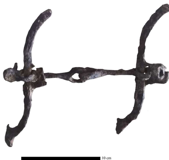
4-расм. S-шаклидаги қўш қантармали сувлук.