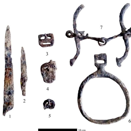
2-расм. Сўнгак мазоркўрғонидан аниқланган темир буюмлар: 1, 2 – пичоқ; 3–5 – от югани тўқалари; 6 – узанги; 7 – сувлуқ ва қантарма.

Figure 1. The restored state of horses and horse equipment based on grave goods (Kyrgyzstan, according to K. Tabaldiev).