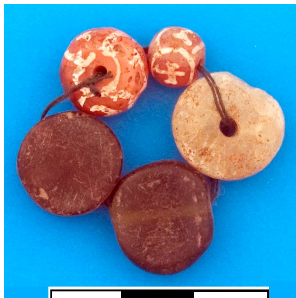
Рис. 1. Орнамент «свастика» на сердоликовых бусинах из Мунчактепа.

Интересным нам представляются три бусины, мастерски украшенные разными вариантами изображений креста – свастики. На памятниках Ферганской долины V–VIII вв. мунчактепинские бусины из сердолика со свастикой достаточно редки. Первая бусина округло-приплюснутой формы, с округлым сквозным отверстием. Орнамент белого цвета из двух скрещенных линий в виде креста, загнутые концы которых идут по часовой стрелке, т. е. это меандровая форма свастики, лучи которой загибаются спиральями (рис. 1), напоминая орнамент вихревой розетки. Вторая бусина поменьше, округлой формы, также со сквозным отверстием, с четырёх сторон орнаментация креста свастики в круге, выполненная белым цветом. Конец одной линии креста загнут. Из многих форм креста свастика является древнейшей (рис. 2). Третья бусина округло-приплюснутая, со сквозным отверстием, якоревидной формы (рис. 3). Сам орнамент «свастика» имеет много значений, у древних народов он был символом движения солнца, солнечным знаком, сакральным (магическим) символом, знаком благополучия, имеющим очень богатую историю и при-