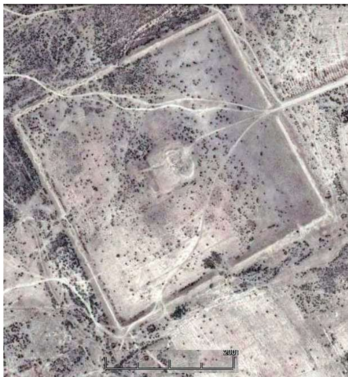
3-расм. Занжир Сарой. Топографик тарх (Раимкулов, Султанова, 2005: 224).

Кейинги асрларда, Чигатой улуси даврида кўчманчи мўғуллар томонидан қурилган Қарши қалъаси ҳам ўзининг квадрат шаклдаги тархи билан Қалъайи Зоҳҳаки Морон қурилишини эслатади (2-расм). Бу шаҳарда ҳам унинг марказида сарой қурилган. Лекин подшо ва унинг