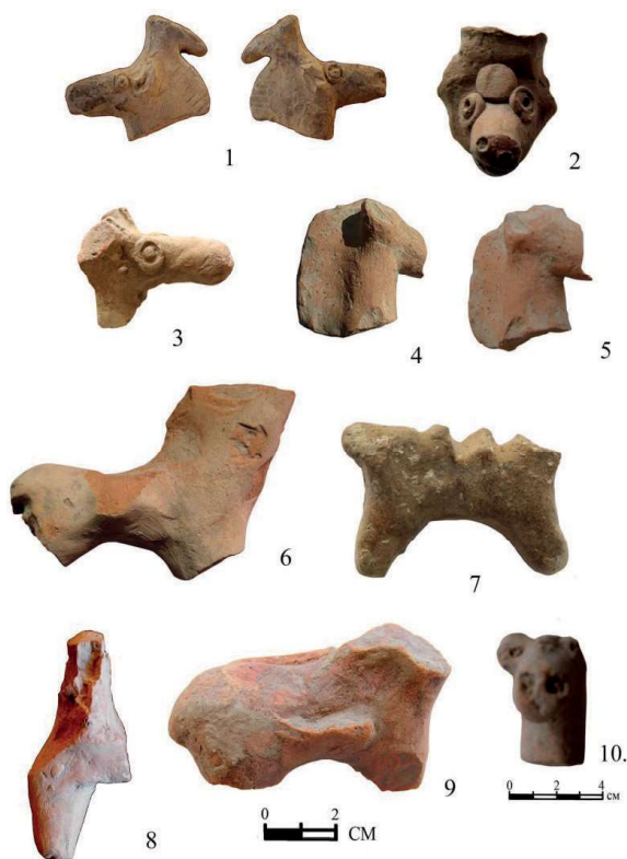
Рисунок 2. Кафиркала. Терракотовые фигурки животных 2-расм. Кофир қалға. Хайвон тасвири туширилган терракота хайкалчалар Figure 2. Kafirkala. Terracotta figurines of animals

технологические особенности изготовления, использование отдельных приемов стилистического анализа способствовали выявлению общих тенденций и своеобразия терракоты Кафиркалы.