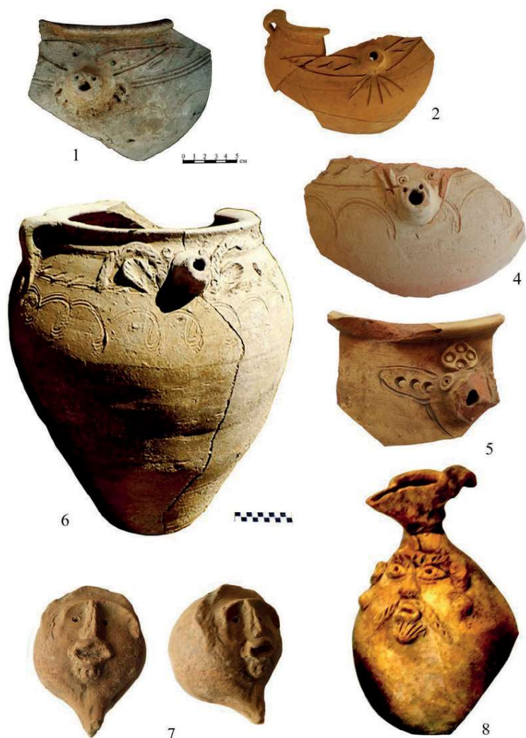
Рис. 5. Сосуды с напедами с зооморфными (1-6) и антропоморфными (7-8) изображениями 5-расм. Идишлар ташқарисига қўл ёрдамида ёпиштириб чиқилган зооморф (1-6) ва антропоморф тасвирлар Figure 5. The site Kafirkala. Vessels with fretworks with zoomorphic (1-6) and anthropomorphic (7-8) images

была захвачена богатая добыча, среди них два рога больших диких быков, вставленных в золото, и золотые кольца обрамляли закраину.