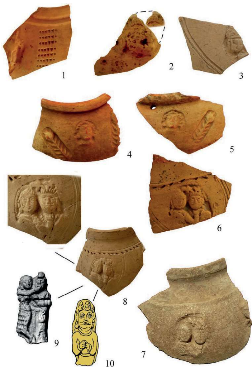
Рис. 7. Сосуды с оттисками штампов с антропоморфными изображениями (1-8); 2 – персонаж с элементом реконструкции; 9 – аналогия – буддийский мотив, «митхуна», изображение любовной пары на терракоте из Индии; 10 – аналогия, согдийская терракота, персонаж в короне с веточками (по Мешкерис, 1989) 7-расм. Антроморф босма тасвирлар акс эттирилган идишлар (1-8); 2 – қайта тикланган сопол идишдаги персонаж; 9 – қиёслаш учун берилган, буддавийлик мотиви-Ҳиндистонда топилган севишганлар тасвири кўринишдаги ҳайкалча; 10 – қиёслаш учун берилган тожиди, ўсимлик шохчалари акс этган сугд терракотаси (Мешкерис бўйича, 1989).

Figure 7. The site Kafirkala. Vessels with impressions of stamps with anthropomorphic images (1-8); 2 – a character with an element of reconstruction; 9 – analogy – Buddhist motive, «mitkhuna», the image of a love couple on terracotta from India; 10 – analogy, Sogdian terracotta, character in a crown with twigs (after Meshkeris, 1989).