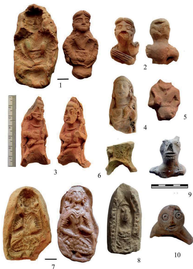
Рис. 4. Антропоморфные терракота: 1 – форма-калыб и оттиск с нее; 2 – верхняя часть антропоморфной фигурки; 3–6 – фигурки воинов-всадников; 7 – калыб и оттиск с изображением сидящей фигуры; 8 – сильно редуцированная плакетка-образок; 9 – фрагментированная фигурка рогатого демонического персонажа; 10 – верхняя часть фигурки антропоморфного существа (духа).

4-расм. 4-расм. Антроморф тасвирли терракота ҳайкалча-чалар. 1 – қолип ва угдан олинган намуна; 2 – антроморфли ҳайкалчанинг юқори қисм; 3–6 – от устида тасвирланган жангчи ҳайкалчалари; 7 – ўтирган одам ҳайкалчаси ва қолип; 8 – кучли редуциланган плакетка – персонаж; 9 – шоҳли маҳлуқ кўринишидаги ҳайкалча фрагментлари; 10 – Антроморф маҳлуқ ҳайкалчасининг юқори қисми.