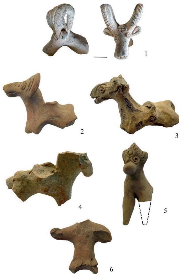
Рис. 3. Кафиркала. Терракотовые фигурки первой группы из раскопок И.А. Сухарева и Г.В. Григорьева 3-расм. Кофир қалъа. И.А Сухарев ва Г.В. Григорьевларнинг қазималари давомиди биринчи топилган терракота ҳайкалчалар Figure 3. Kafirkala, analogy. Terracotta figurines of the first group from the excavations of I.A. Sukharev and G.V. Grigoriev